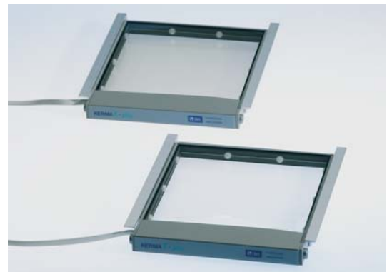
KermaX plus DDP "Duo"