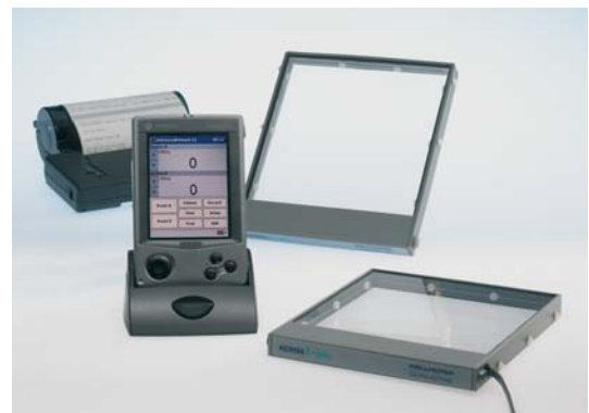
KermaX plus MPC "Duo"