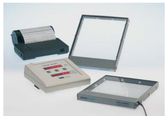
KermaX Plus DDP Duo