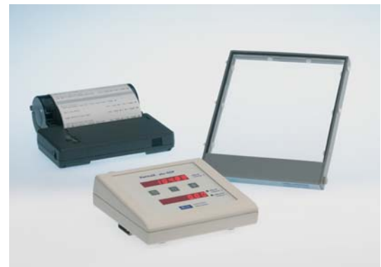
KermaX Plus DDP single