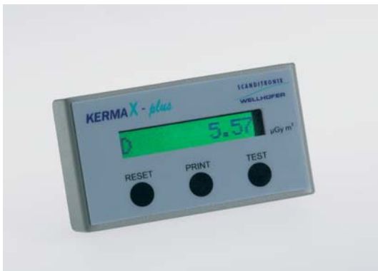
KermaX plus-Single line display