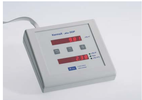
Dual line display unit for KermaX Plus DDP