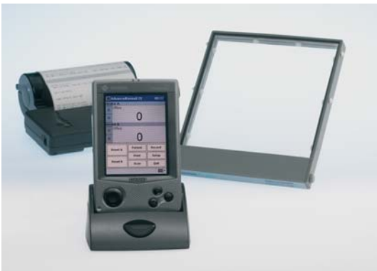
KermaX plus MPC single