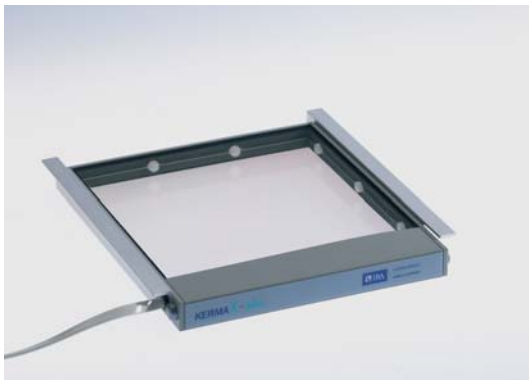
KermaX plus Single