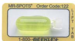
Réf : 122

Les tubes de 1.5 cm marquent les extrémités, les masses de tissu mou ou des régions plus petites. La longueur de 1.5 cm identifie des zones spécifiques d'intérêt dans lesquelles un marqueur plus petit est nécessaire.