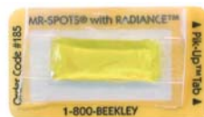
Réf : 185