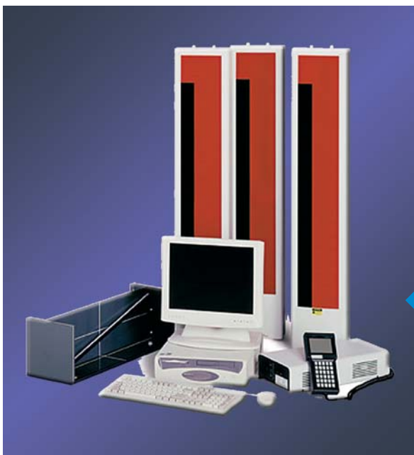
Modèle A 3000A