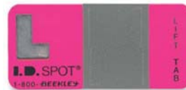
Réf : 112

Marqueurs métalliques d'orientation gauche (L) et droite (R), avec une barre ID pour faciliter la documentation.