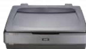
Scanner Epson 11000XL